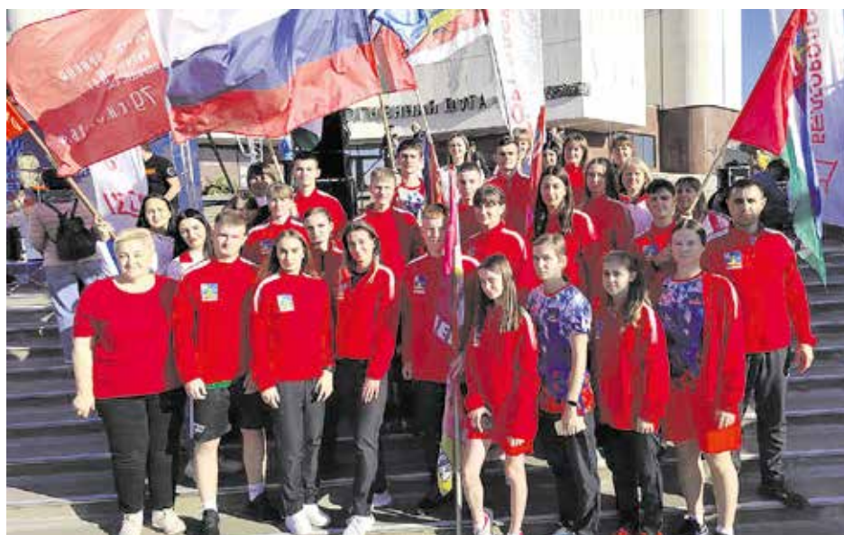
Команда легкоатлетов Краснояружского района

А победителем эстафеты в общем зачёте стал Белгород. Теперь до конца следующего года здесь будет построен новый ФОК.