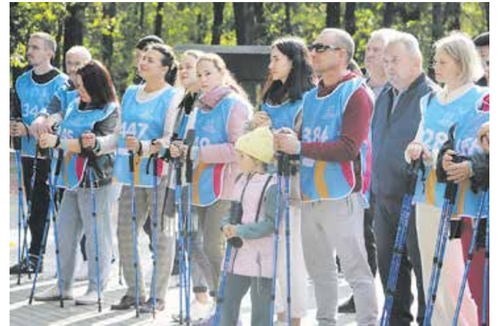
Северной ходьбой стали увлекаться и дети

процесс. По их словам, они получили огромный заряд бодрости и положительных эмоций. Всем командам вручили медали и сертификаты.