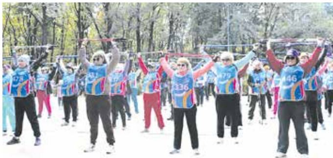
Разминка перед стартом

По итогам состязаний, конечно же, были определены победители, но для многих участников праздника был важен сам